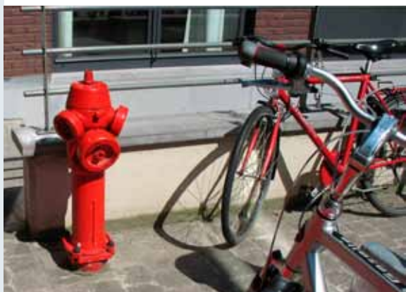
Zorg ervoor dat brandkranen steeds worden vrijgehouden.