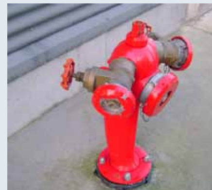
Een bovengrondse brandkraan is rood.