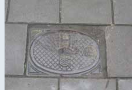
Een ondergrondse brandkraan herken je aan het ijzeren dekselvrijgehouden.

Brandkranen herken je ook via een bord in de buurt van de kraan. Deze borden duiden precies aan waar de brandkraan staat.